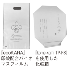
『ecoKARA』 卵殻配合バイオマスフィルム

当者は「企業の環境や社会的責任への姿勢を伝えるコミュニケーションツールとして活用してほしい」としている。